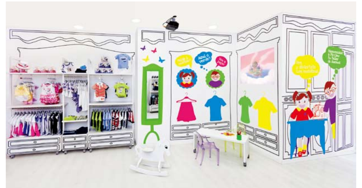
The wall is filled with vivid color graphics