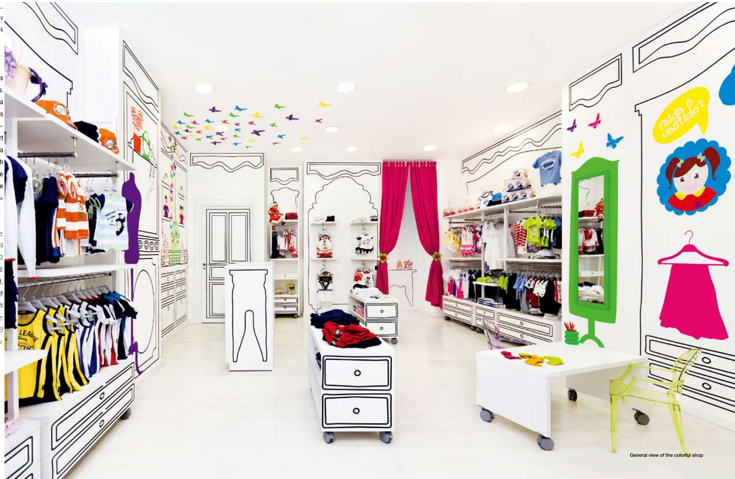
General view of the colorful shop

마스크스파시오는 최근 과학의 도시 발렌시아에 <피치노>라는 새로운 매장을 디자인했다. <피치노>는 브렌스와 빔부스 같은 이탈리아 브랜드의 어린이 의류를 발렌시아에 수입해 판매하는 매장으로, 0세부터 14세까지의 의류를 취급하기 때문에 부모와 아이들을 함께 매장으로 끌어들이 수 있는 신선하고 현대적이며 유치한 이미지가 필요했다. 매장 내부는 진열된 옷 자체가 강조될 수 있도록 흰색으로 마감됐으며, 벽면에는 장난스러운 이미지의 두 명의 '아이'가 그려졌다. 이 아이들은 선명한 색상을 띠며, 새로운 친구를 위해 옷을 디자인하는 듯한 모습으로 고객을 반겨준다. 고전적인 가구를 재미있게 흉내 낸 가구는 비닐을 이용해 표현된 것으로, 이는 선반을 비롯한 실제 가구들과 결합된다. 공간에 배치된 여러 자석판은 아이들이 스스로 자신의 옷을 만들 수 있게 하며, 여기에는 아이들이 만화영화를 시청할 수 있는 공간도 마련되어 있다. 또한, 매장에 배치된 카르텔의 루 루 고스트 의자는 마치 이 매장을 위해 만들어진 것처럼 보인다. 이처럼 <피치노>는 사람들을 새롭고 신선한 콘셉트의 공간으로 인도해준다. 글 : 마스크스파시오