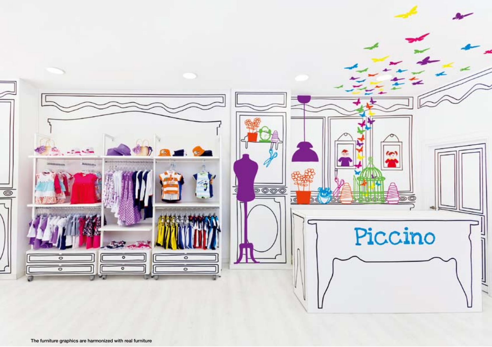
The furniture graphics are harmonized with real furniture