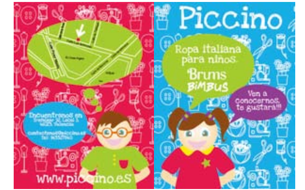
The poster of Piccino

Design _Masquespacio Graphic design _Ana Milena Hernández Palacios / Masquespacio Client _Piccino Location _Trafalgar 52, Local 5, 46023 Valencia, Spain Built area _38m 2 Completion _May 2012 Editorial designer _Choi Jungsuck Editor _Lee Hyeekyung