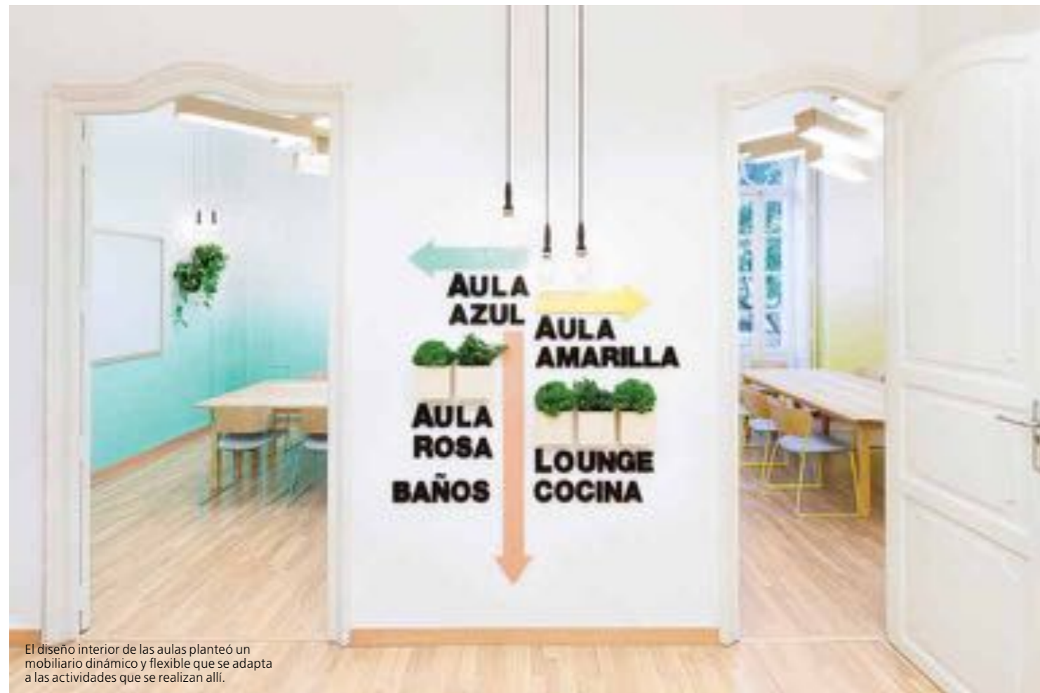
El diseño interior de las aulas planteó un mobiliario dinámico y flexible que se adapta a las actividades que se realizan allí.