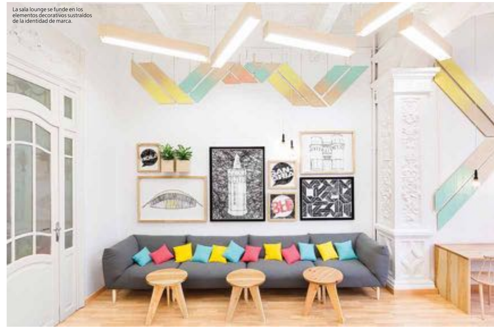
La sala lounge se funde en los elementos decorativos sustraídos de la identidad de marca.