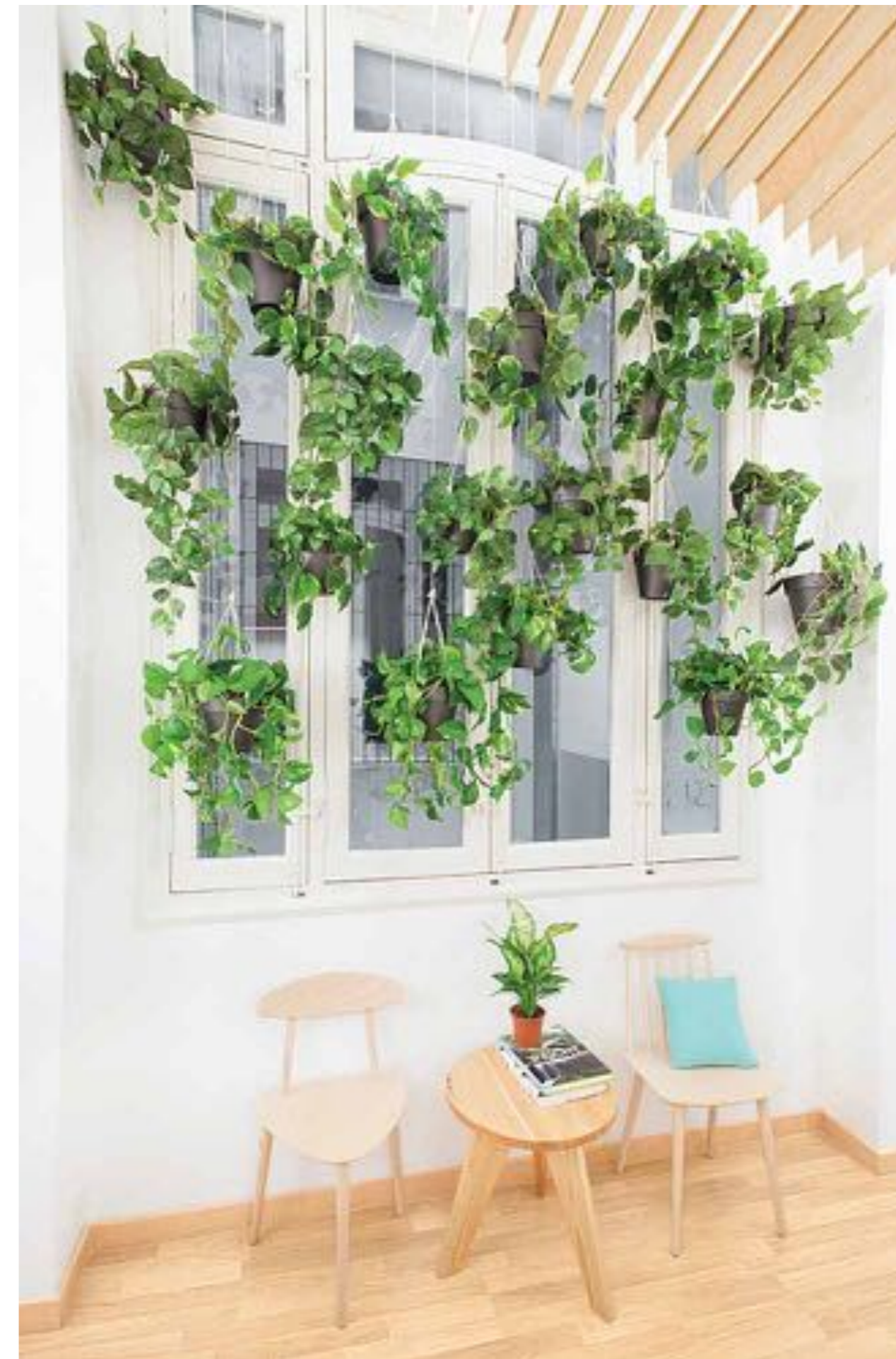
Algunas zonas de estar se complementan con la implementación de vegetación interior, muy acorde con los tonos cálidos de los materiales del lugar.