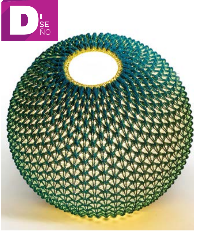
Imagen cortesía de @Ariel Zuckerman/fotografía Yoav Gurin