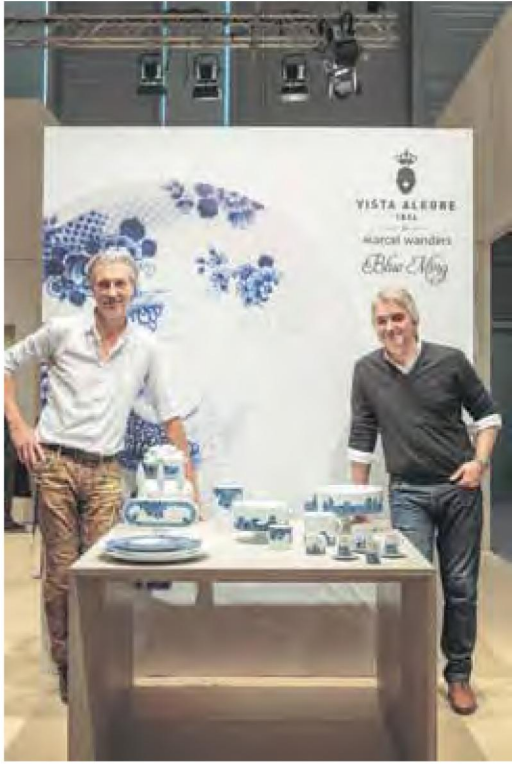
Imágenes: Cortesía Vista Alegre