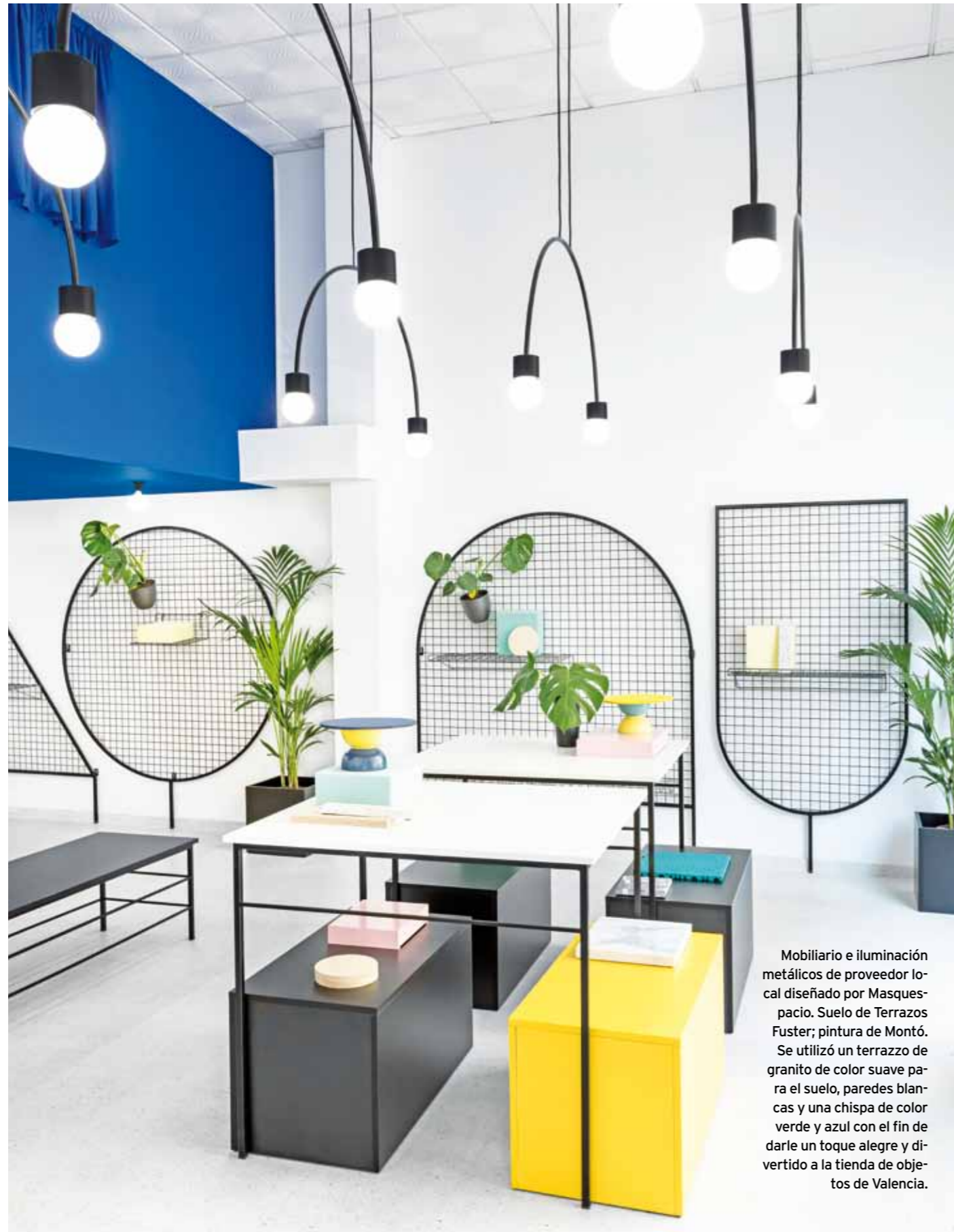
Mobiliario e iluminación metálicos de proveedor local diseñado por Masquespacio. Suelo de Terrazos Fuster; pintura de Montó. Se utilizó un terrazo de granito de color suave para el suelo, paredes blancas y una chispa de color verde y azul con el fin de darle un toque alegre y divertido a la tienda de objetos de Valencia.