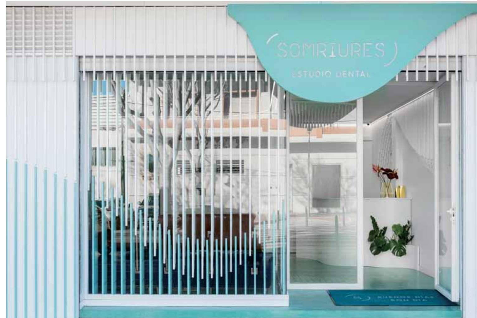
left page. 상담실의 가구 역시 라운드 형태를 선택했다. this page. Somriures의 외관은 재료를 최소로 사용해 전체적으로 진지하고 세련된 디자인을 선보였다.