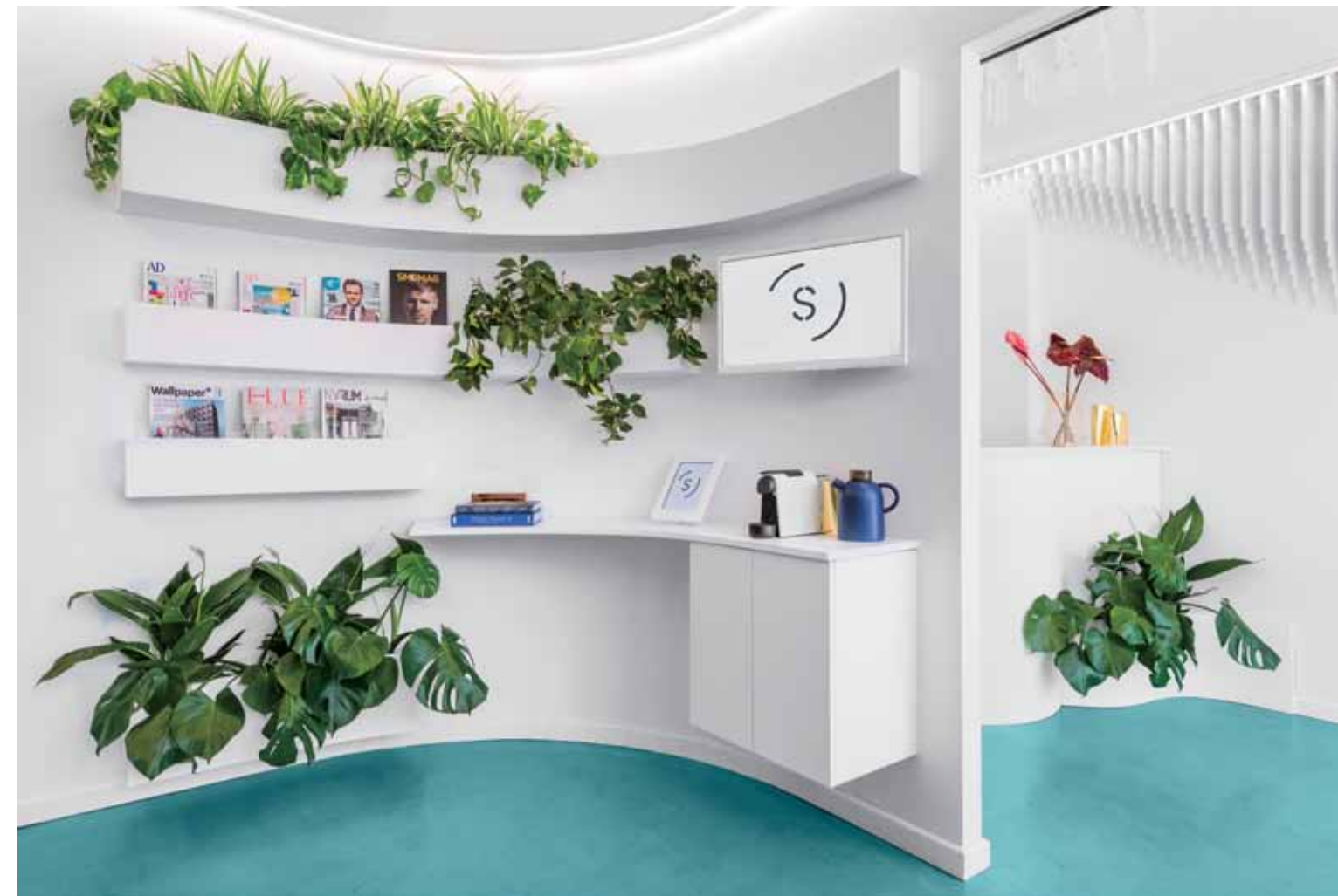
previous page. 공간 전체에 화이트 컬러와 터퀴즈 그린 컬러를 조합해 깨끗한 이미지를 연출했다. left page. 천장에 매달린 2884개의 스트립 나무 조각은 아름다운 미소를 재현한 디자인이다. this page. 선반 디자인도 라운드 형태로 전체 공간에 통일감을 부여했다.