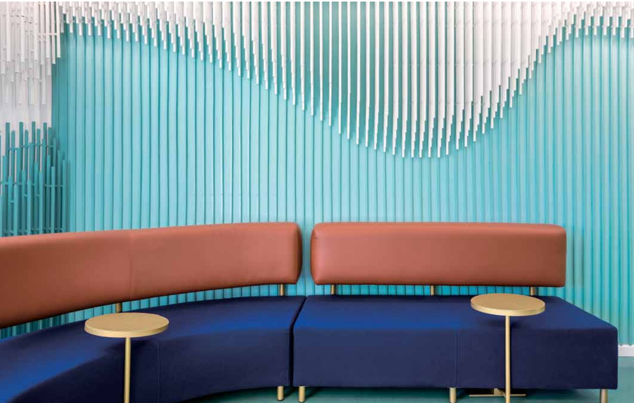
this page. 가구는 골드, 브라운, 다크 블루 컬러를 사용해 포인트를 줬다. right page. 전체적인 공간에서 보이는 유기적인 형태는 전체 콘셉트인 아름다운 미소의 개념과 완벽하게 일치한다.